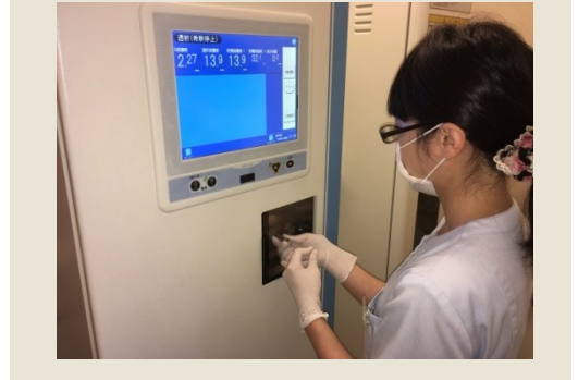
検体のサンプリング